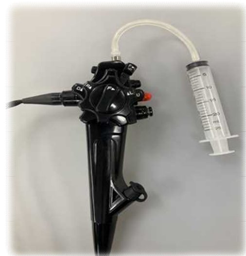
(シリンジで手動のイリゲーションが可能)