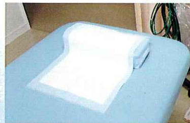
内視鏡時使用イメージ