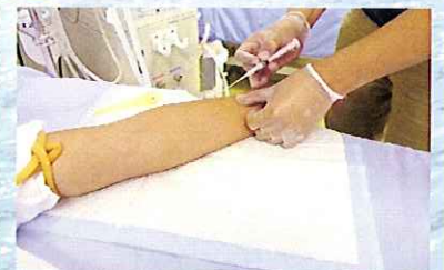
穿刺時に血液が付着するのを防止