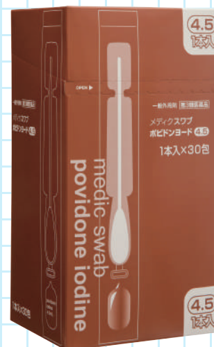
メディクスワブ ポビドンヨード 4.5