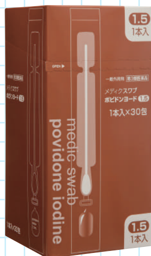
メディクスワブ ポビドンヨード 1.5