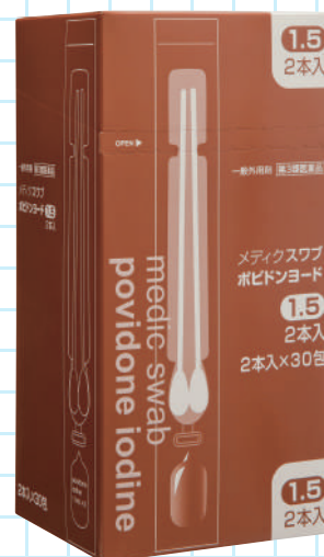
メディクスワブ ポビドンヨード 1.5 2本入