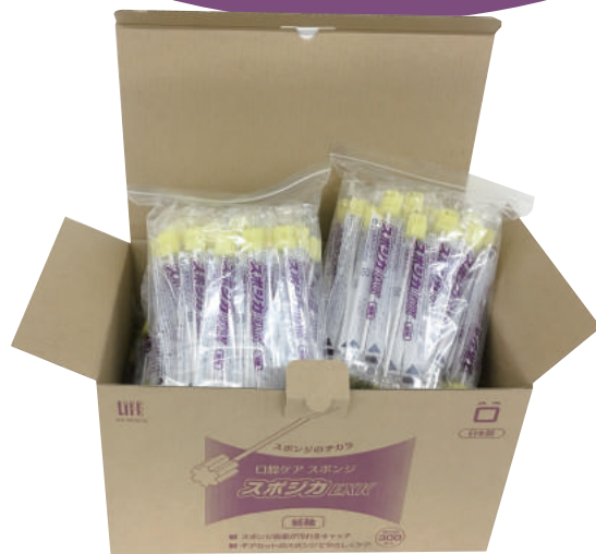
スポンジカ EXK300 本入