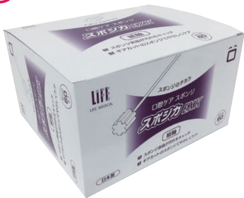
スポンジカ EXK60 本入